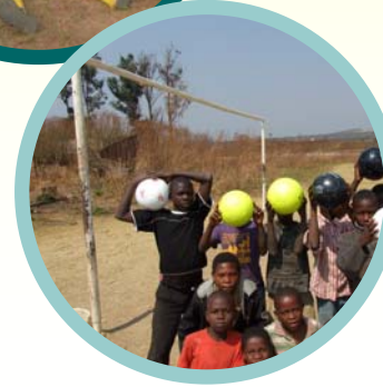
República Democrática del Congo